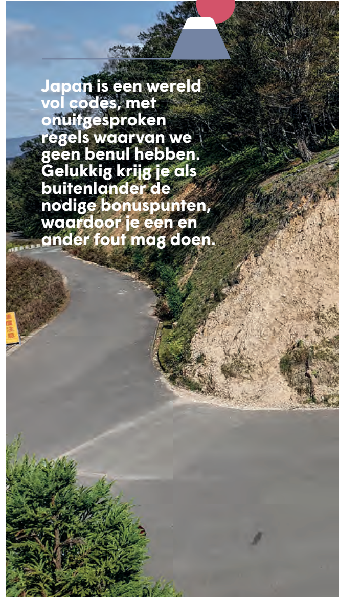
De Onyu pas: prachtige bochten, compleet verlaten.

Japan is een wereld vol codes, met onuitgesproken regels waarvan we geen benul hebben. Gelukkig krijg je als buitenlander de nodige bonuspunten, waardoor je een en ander fout mag doen.