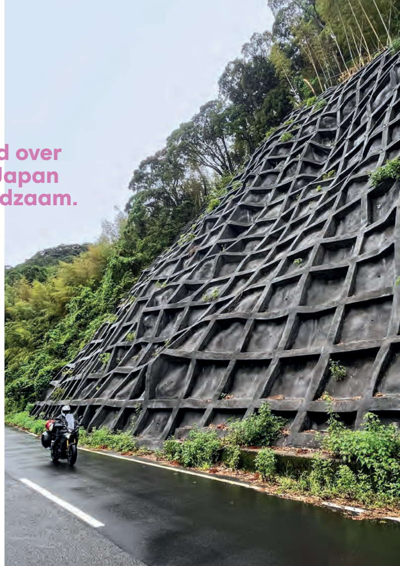
Japan is aardbevingsgevoelig, en dus zijn veel rotswanden gecementeerd om steenlawines te vermijden.

Na het avondeten worden we spontaan uitgenodigd voor een avondje sterrenkijken. Er is hier zo weinig stoorlicht dat we zelfs op een bewolkte avond de ringen van Saturnus kunnen zien. Als we licht onderkoeld terug in het hotel komen, duiken we meteen de onsen in – het warme, publieke bad.