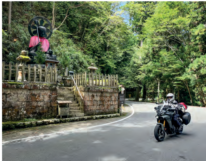
Een van de Boeddha's bij Koyasan.