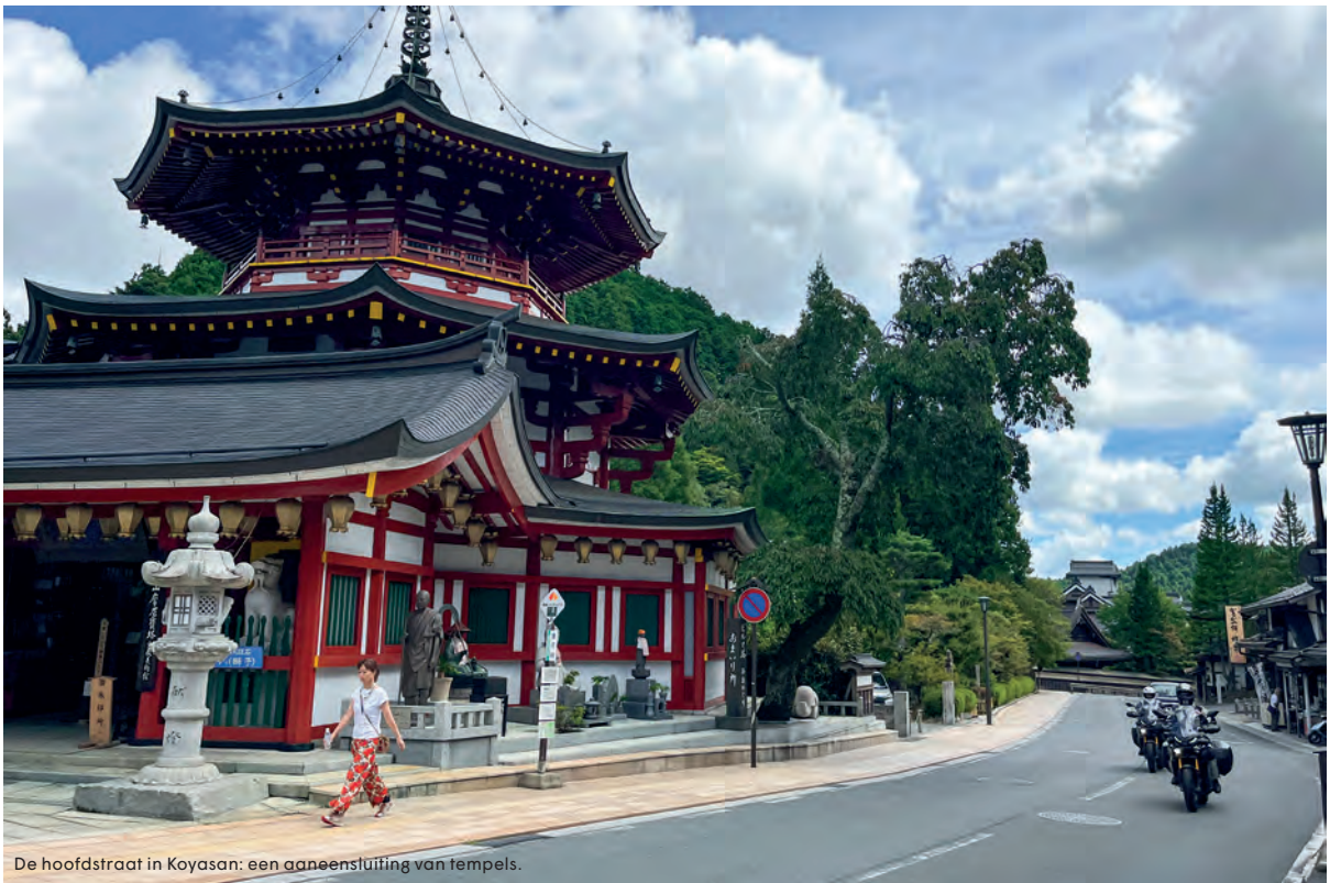
De hoofdstraat in Koyasan: een aaneensluiting van tempels.