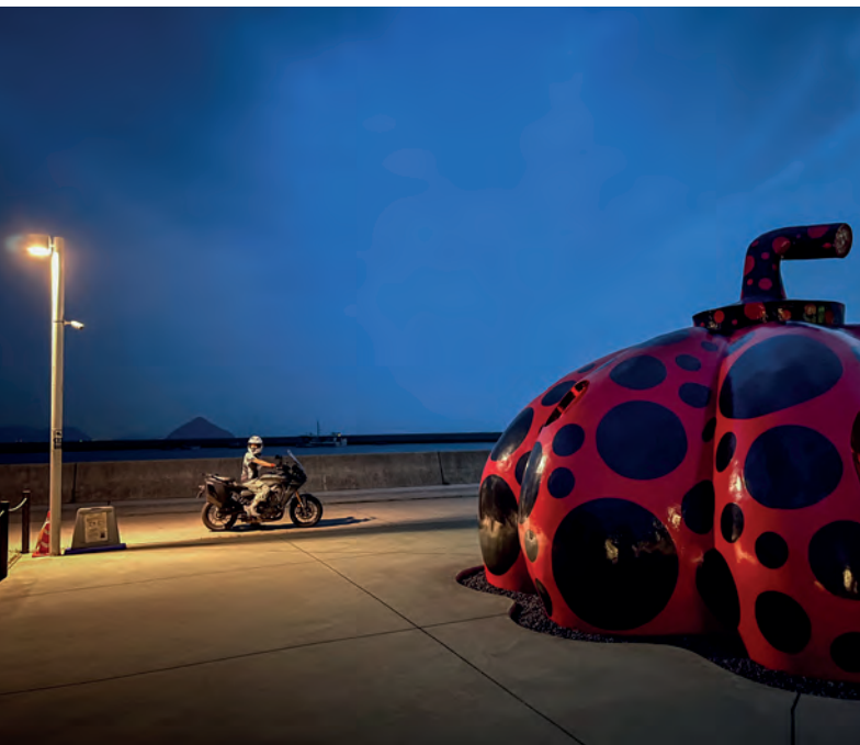
De iconische pompoen van Yayoi Kusuma, op Naoshima.

begroeide poorten: torii – letterlijk ‘vogelzitstok’ – die de overgang van het alledaagse naar het heilige markeren. Nergens anders zou ik zo ontspannen ’s nachts tussen de graven dwalen, maar we hebben het Japanse veiligheidsgevoel al helemaal geabsorbeerd. In de zes weken dat we door het land rijden, zien we nauwelijks politie en er staan (gelukkig) ook bijna geen flitscamera’s en geen bewakingscamera’s. Er zijn gewoon regels en iedereen houdt zich daaraan.