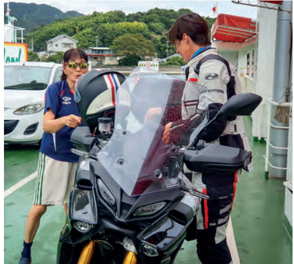
Pontje bij Setoba: een chauffeur die ongeduldig toeterde komt het goedmaken met een koekje.

Dat wij met grote motoren de baan op willen, wekt verbazing: blijkbaar zijn vrouwen op een motor hier nog eerder uitzondering dan regel.